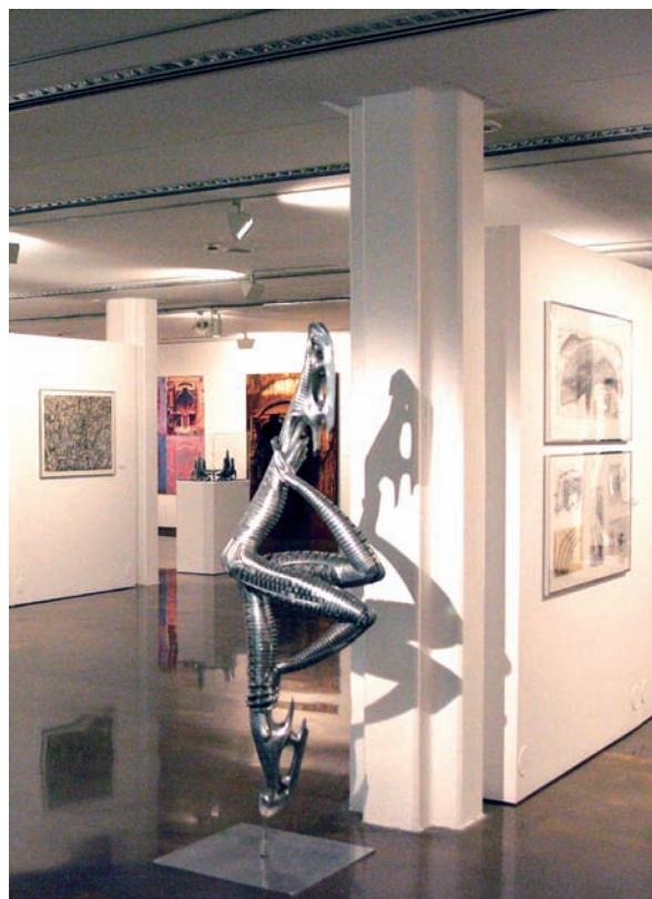
Vista de l'exposició dedicada a H. R. Giger a la UPV en 2007.