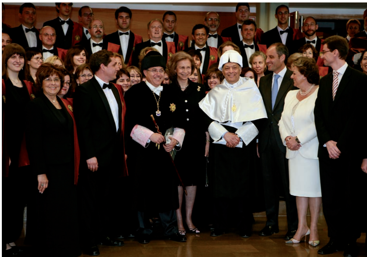
Acte de celebració de la investidura de Zubin Mehta com Doctor Honoris Causa, amb la presència de S. M. la Reina Na Sofia.

de primer ordre a escala estatal, amb el suport de forces locals, entengueren la necessitat que tenia per al futur de la indústria i la tecnologia valenciana la creació d'un centre educatiu que oferira garanties per a atendre els nous reptes a què la societat de llavors s'enfrontava.