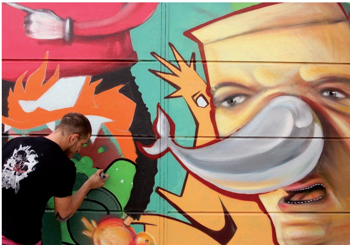
Celebració del III Festival d'Art Urbà de la UPV Poliniza, dins els actes de celebració del 40 aniversari.

com a prioritat estratègica i convençuda de la importància que té disposar el seu potencial científic al servei del desenvolupament econòmic de la societat valenciana, va convocar experts mundials en el tema i va fer possible a través d'aquesta conferència un punt de trobada de primeríssim nivell dirigit a empresaris, professors i investigadors d'universitat, en definitiva, a tots els professionals vinculats al món de la innovació, dos intensos dies plens d'informació, debat i intercanvi d'idees.