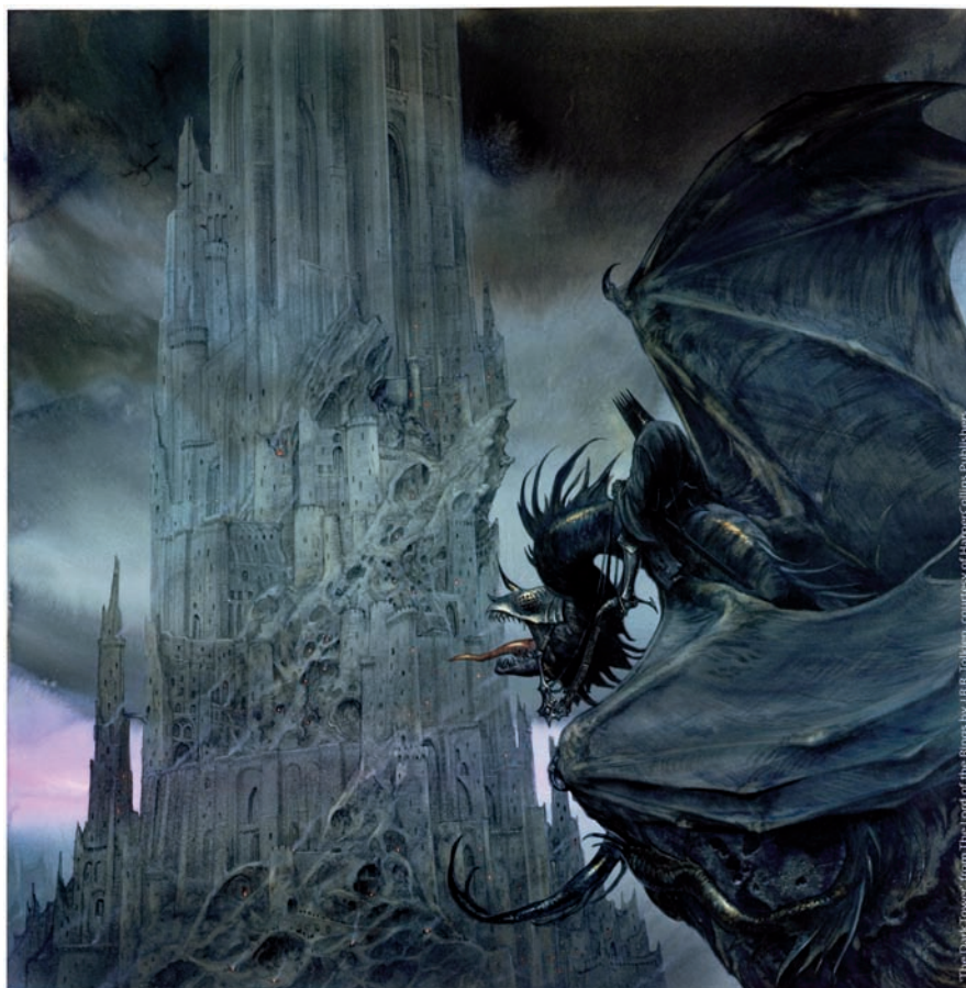
The Dark Tower from The Lord of the Rings, by John Howe