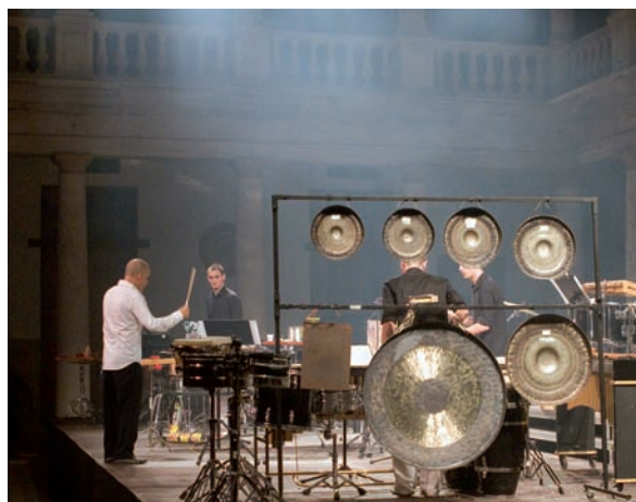
L'oferta cultural de La Nau és global i permet al ciutadà gaudir tant d'actes com conferències, com d'actuacions musicals o utilitzar la meravellosa biblioteca.

anuals, la mitjana que estem tenint en els últims exercicis.