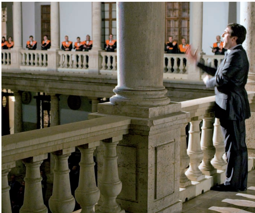
L'orfeó de la Universitat de València, durant una actuació a la part superior del claustre de La Nau.

“En els deu anys de vida de La Nau s’han fet moltes coses. S’ha convertit en un punt de referència de la UV”