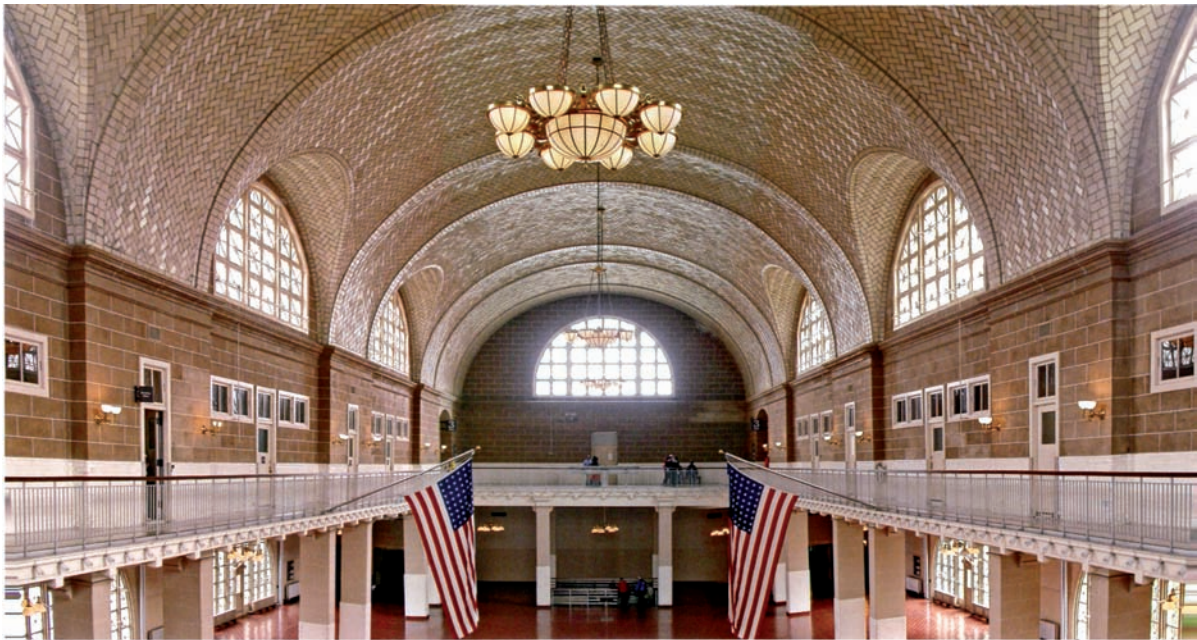
Sala principal del actual Museo Nacional de Inmigración. Guastavino Co. fue el arquitecto de la cubrición tras su derrumbe. Abajo Folleto propagandístico de la compañía.

nacional, especialmente en los Estados Unidos.