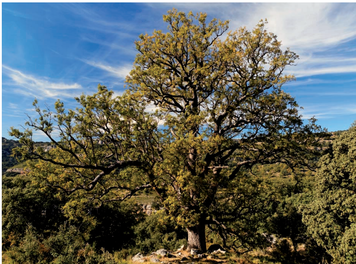
Quejigo monumental dentro de la Finca Forestal "Barranc del Horts-Mas Vell" gestionada por Bancaja Fundación Caja Castellón.

Almassora y en Castellón en el Centro Cultural Casa Abadía, en el Centro Cultural Grupo San Agustín y en el Edificio Hucha, junto al club de jubilados dedicada exclusivamente a gente mayor.