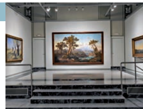
Exposición: "Reflejos del Mediterráneo".

Horario: De lunes a domingo de 17.30 a 21 horas. Sábados domingos y festivos de 11 a 14 horas.