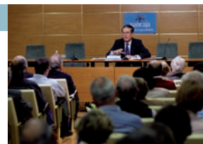
Federico Mayor Zaragoza, en el Edificio Hucha.

Horario: De lunes a viernes de 8 a 21.00 horas