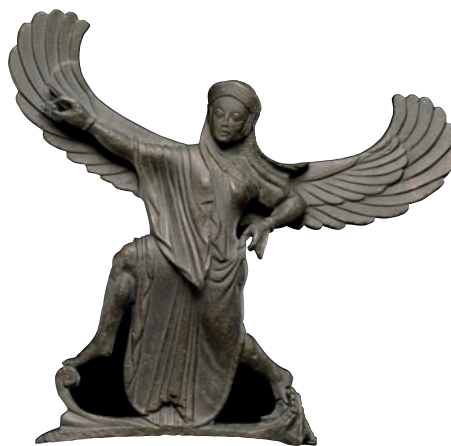
Estatuilla de bronce de Nike. Griego, manufactura del sur de Italia, tal vez de Tarento, en torno al 500 a. C.

nio, el sexo y el deseo. La representación de los dioses y héroes griegos tendrá albergue en la Sala Conde Lumieres del museo alicantino.