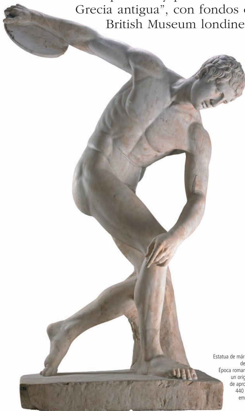
Estatua de mármol de un lanzador de disco (diskobolos). Época romana, siglo II, copia de un original griego perdido de aproximadamente 450-440 a. C., de la villa del emperador Adriano en Tívoli, Italia.

Desde el 3 de abril, el Museo Arqueológico Provincial de Alicante exhibirá la muestra “La Belleza del Cuerpo. Arte y pensamiento en la Grecia antigua”, con fondos del British Museum londinense.