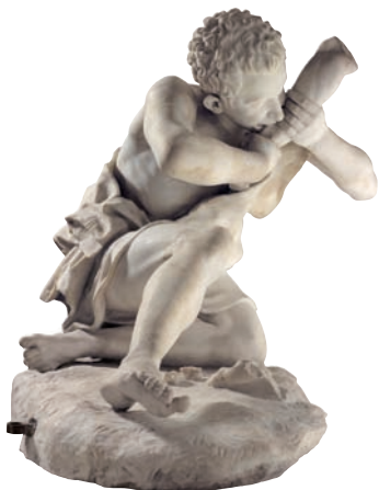
Muchachos peleándose por un juego de tabas. Escultura de mármol. Época romana, siglo I, copia de un original del siglo II a. C., procedente de Roma

combinaciones monstruosas de la forma humana y animal.