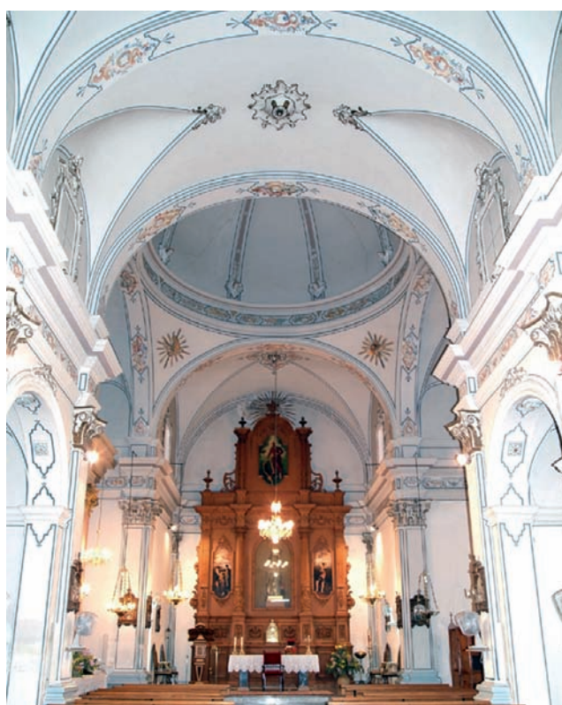
imagen aparecida al ermitaño. Se tiene constancia de que esta ermita contó con varios altares. Así, además de los de San Roque y el Cristo de la Peña, tenía aras dedicadas a San Pascual y San Cayetano, entre otros.

En el interior del oratorio, que fue restaurado en 1976, se puede admirar la imagen del Santísimo Cristo de la Peña, considerado como el segundo patrón de la localidad. Según la tradición, se trata de una