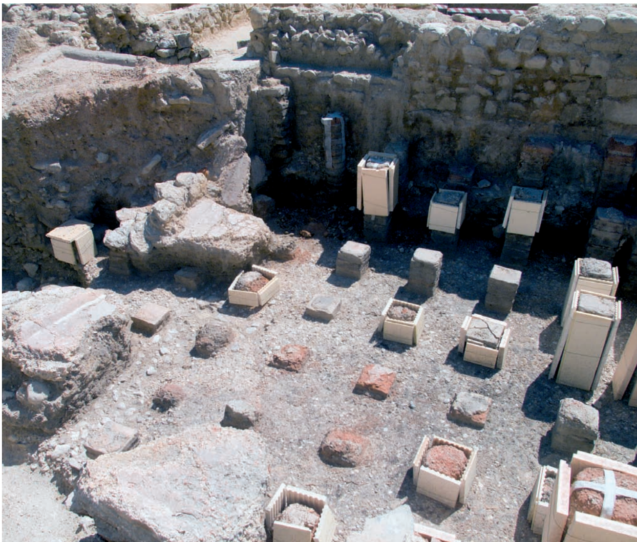
En la imagen superior, trabajos de consolidación del "caldarium", o sala de agua caliente.

ritualmente en una ceremonia hecha seguramente para tomar los auspicios del fabuloso monumento termal que se erigía en el nuevo municipio. El propio Quinto Manlio, el único alcalde que conocemos todavía, pudo presenciar aquel sacrificio.