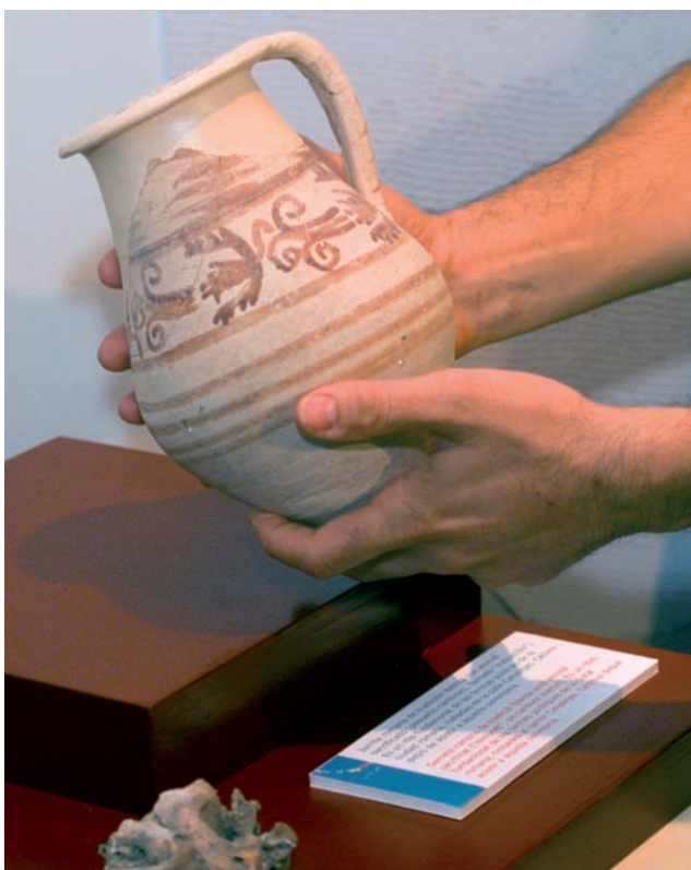
Jarra ritual que se encontró durante los trabajos de excavación en las termas romanas de Allon.

En aquellas fechas, según afirma el cronista Gaspar Escolano en su Historia del Reino de Valencia, se estaban extrayendo piedras de la ciudad romana para construir la nueva muralla renacentista de Villajoyosa, destruida pocos años antes por un terrible ataque de corsarios turcos. La propia mesa